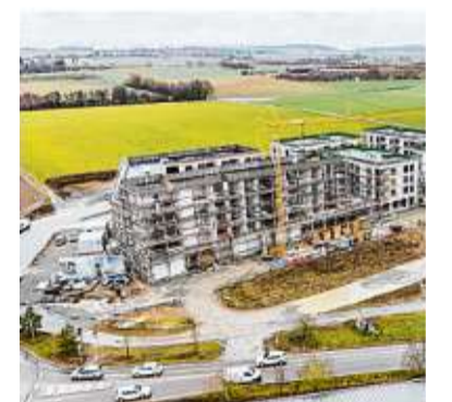
Die Schenkenhöhe von der Luft aus fotografiert.

Info Der Tag der offenen Baustelle der Schenkenhöhe ist am Samstag, 28. März, 11 bis 15 Uhr. Geführte Rundgänge starten zu jeder vollen Stunde. Einzelführungen können gebucht werden auf www.schenkenhoe.de/tag-der-offenen-baustelle/ oder per Telefon 07 91 / 9 70 44 43. Navigation: Bei Google-Maps „Schenkenhöhe“ eingeben; Zufahrt gegenüber Lidl.