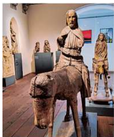
Ein Blick in die Abteilung mittelalterliche Frömmigkeit.

Info Teile des Museums sind nicht barrierefrei zugänglich.