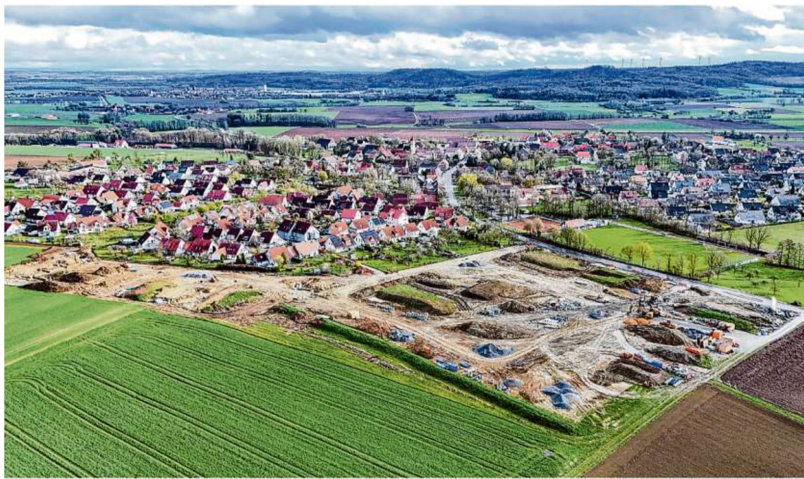
Das Baugebiet Langwiesen in Tübingen. Der nordöstliche Zipfel (unten links), soll mit 15 Bauplätzen vermarktet werden.