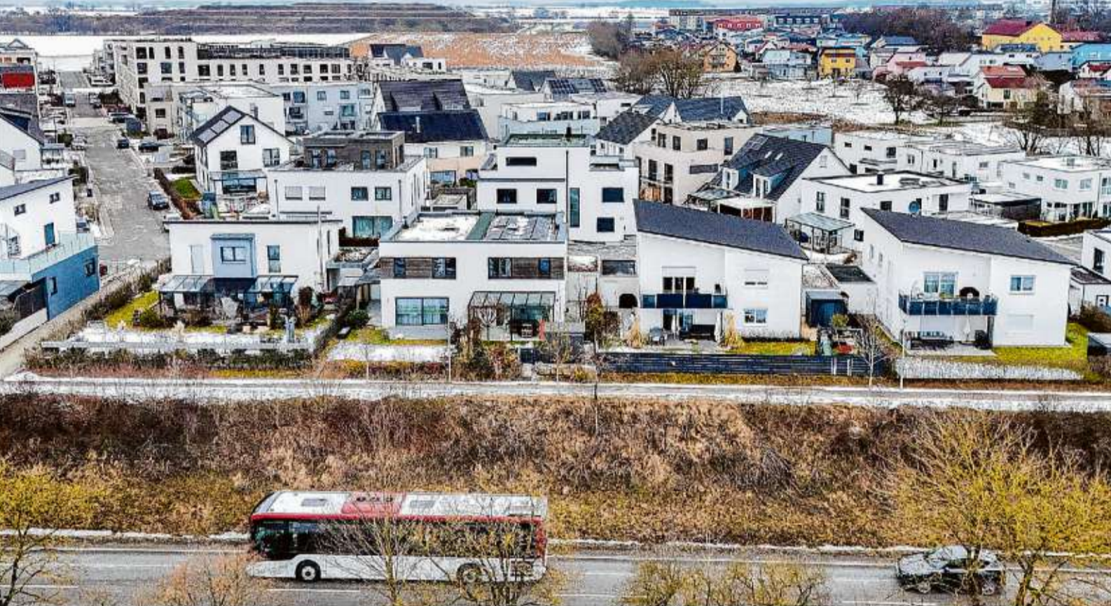
Die letzten regulären Einfamilienhausbauplätze im Stadtkern – im Baugebiet Sonnenrain – wurden bereits vor Jahren vergeben.

Immobilien Bewerber sollen durch soziale und ortsgebundene Aspekte punkten. Doch es gibt auch Verkäufe zum Höchstgebot. Der Rat entscheidet noch. Von Thumilan Selvakumaran